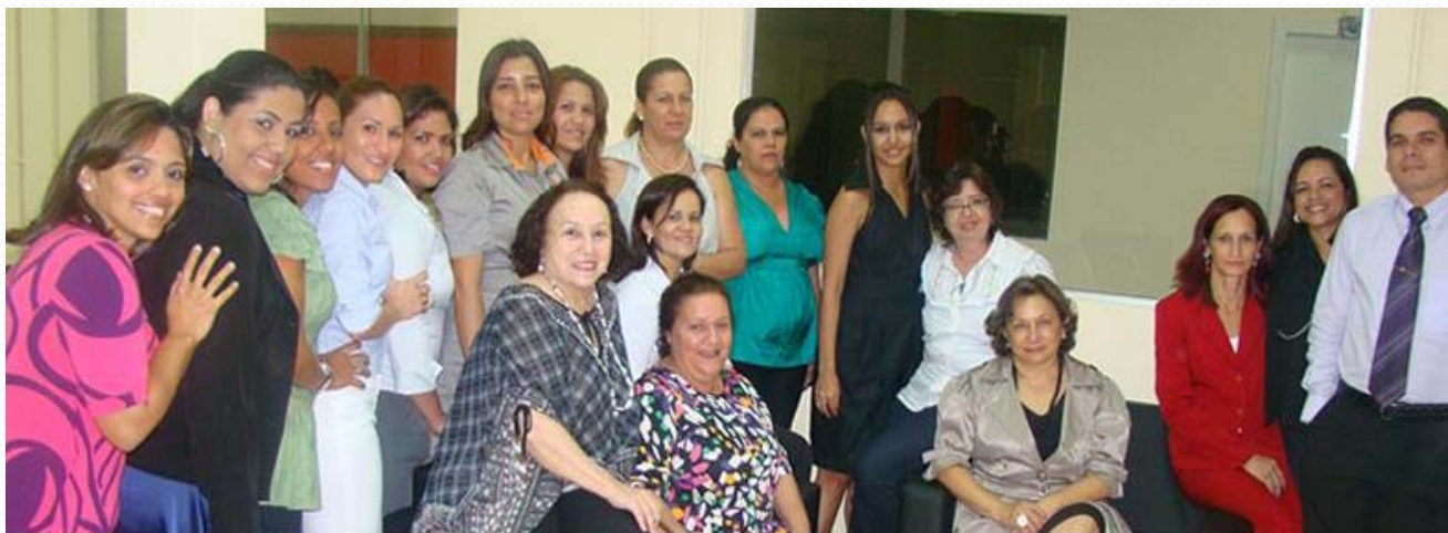
Membros da Câmara Cível com Servidores da Secretaria e dos Gabinetes.