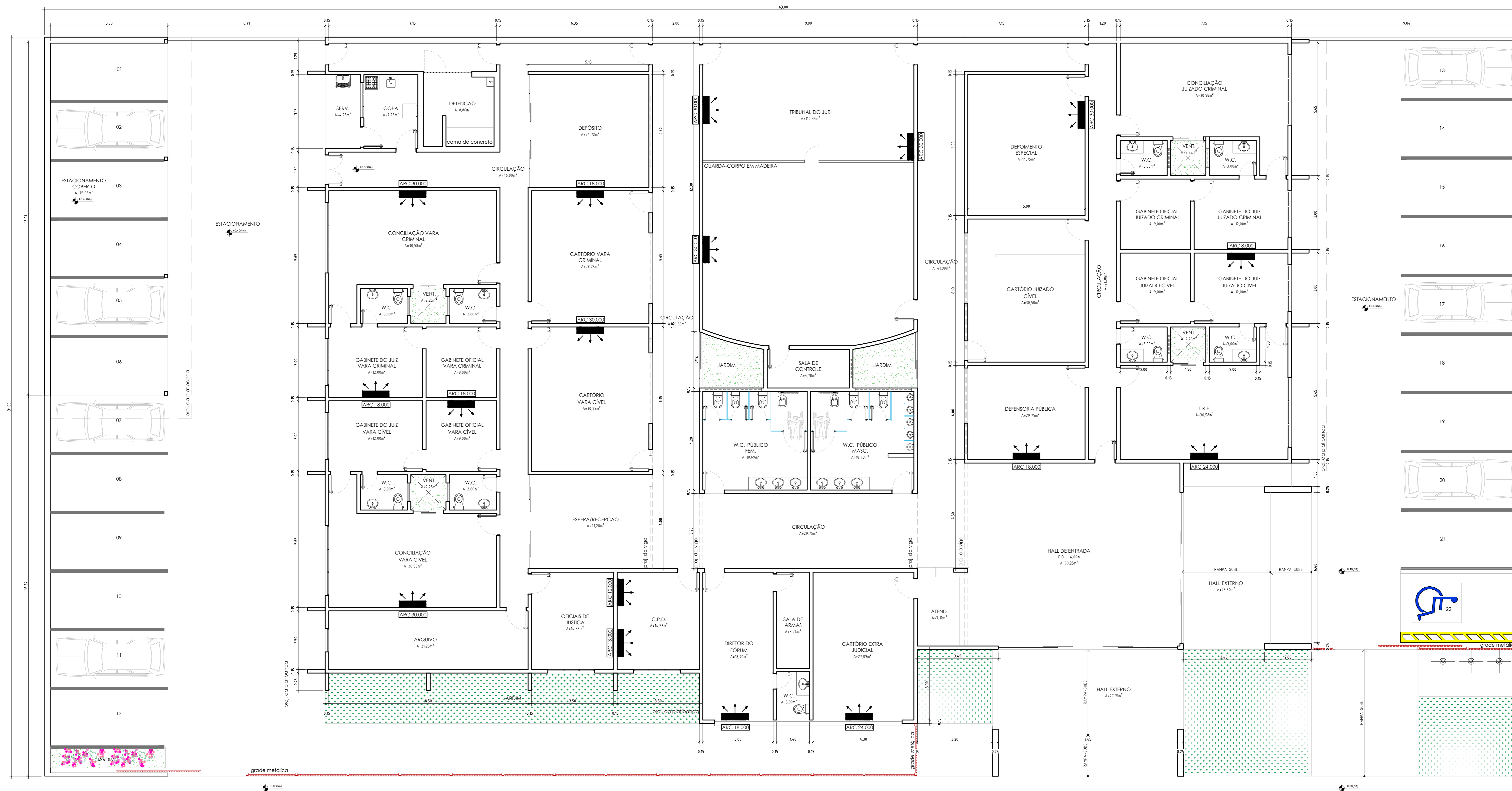
PLANTA BAIXA - EXISTENTE Esc. 1/75