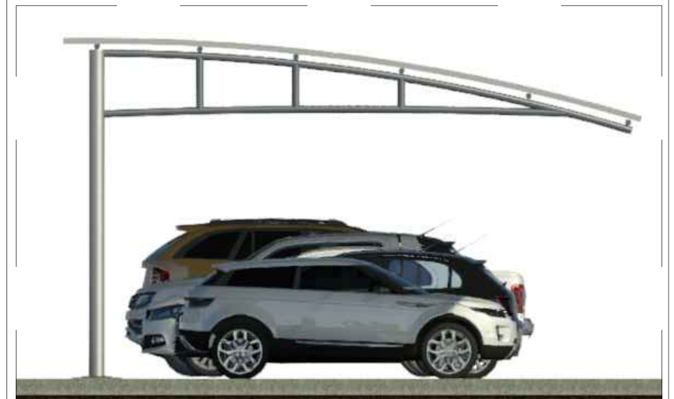
VISTA DA COBERTURA DO ESTACIONAMENTO