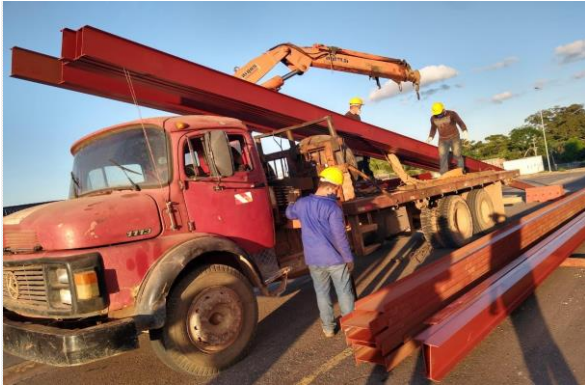
Foto 1 - Estrutura metálica sendo posicionada no canteiro de obras.