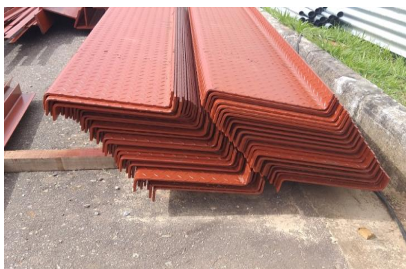
Foto 5 - Degraus em chapa de aço xadrez.