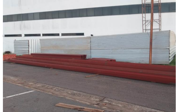
Foto 2 - Estrutura metálica entregue na obra.