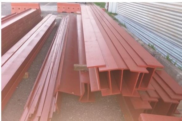
Foto 3 - Pilares metálicos W 250x44,8 no canteiro.