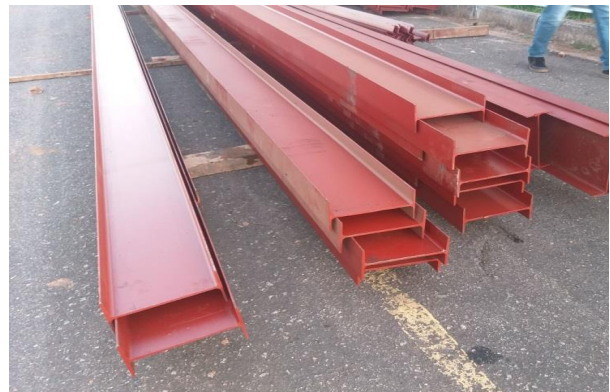
Foto 4 - Vigas metálicas W 250x17,9.