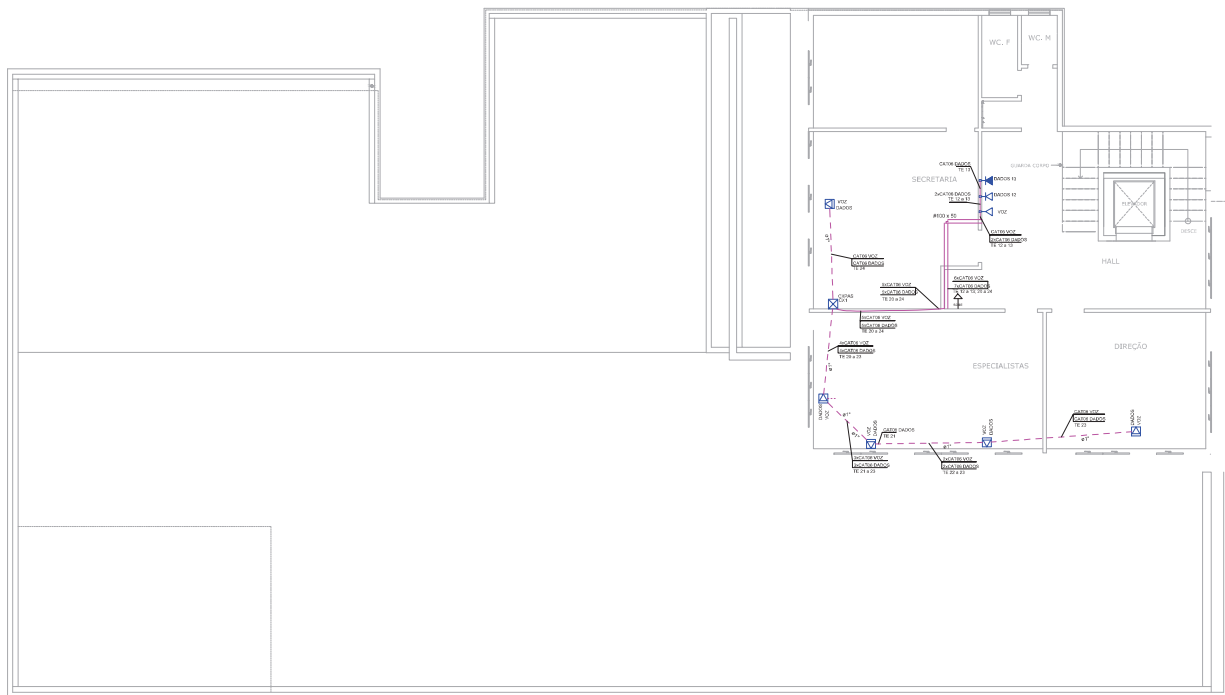
PLANTA SUPERIOR PAV. SUPERIOR